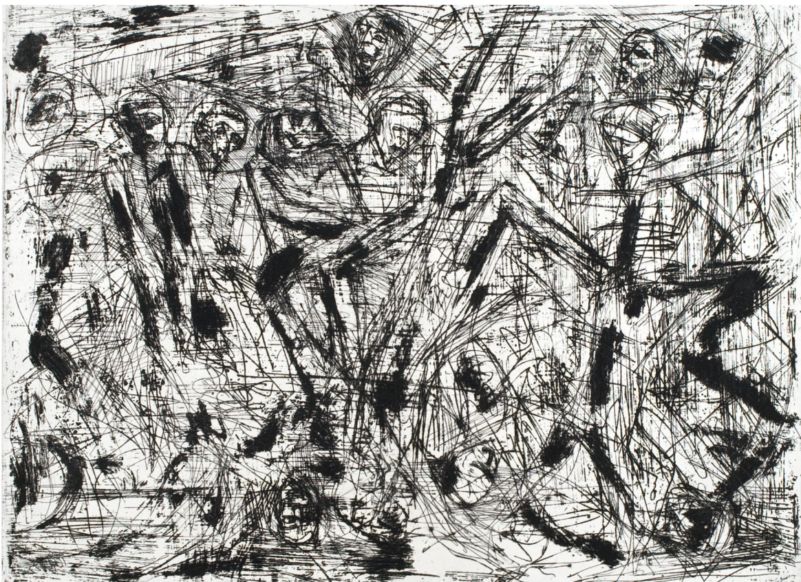
— Przybycie do Sachsenhausen (luty 1945 r.) —