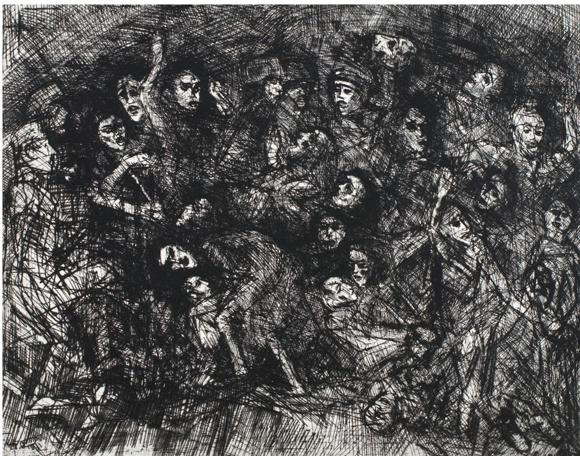
— Masakra z 16 sierpnia 1943 r. —